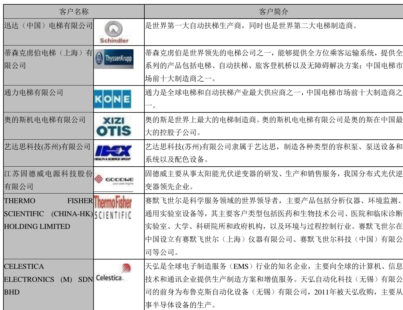
公司部分重点客户情况

公司与客户间着力构建稳定、双赢的合作模式。此类优质客户要求其供应商必须取得国际通行的质量管理体系认证，同时，还需通过其更为严格的合格供应商认证，才可进入其供应商序列，合作关系相对稳定。公司通过在精密箱体系统制造领域十余年的耕耘和业务开拓，系统集成设计水平、技术研发能力、产品质量保证、制造服务能力、快速反应能力和专业技术支持服务等均位居行业领先水平，现已成为众多全球知名企业中国区长期而稳定的核心供应商，并积累了一批优质国内企业的客户资源。