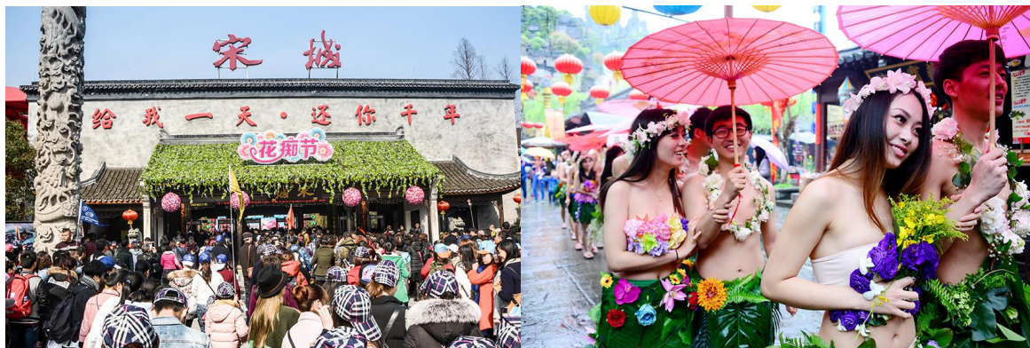
杭州宋城景区花痴节人气火爆

报告期内, 杭州宋城景区克服不利天气、当地市场环境等影响, 仍实现了高基数上的稳健增长。景区通过新增星巴克咖啡、美食街等商务区域以及亲子游乐区、散客接待大厅等功能区域, 在丰富游玩体验的基础上, 为游客提供了更加安全、舒适的接待氛围。此外通过清晰的战略定位和持续的内容丰富, 作为大本营项目的杭州宋城景区出现了喜人的趋势——游客结构趋于年轻化, 散客、自驾游和终端市场的营收比例首次超过了团队游客贡献的营收, 且该比例呈持续上升态势。