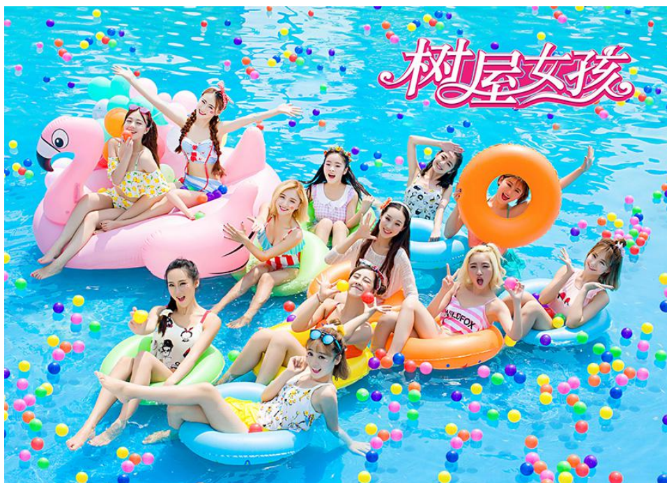
中国大型演艺女子天团——树屋女孩

报告期内，基于网络主播专业化的发展趋势，公司开始进入主播培训领域。2016年6月8日，公司与浙江传媒学院继续教育学院签署了《“浙传宋城班”委托培养协议书》，未来双方培养的高素质主播人才将服务于宋城演艺旗下的现场娱乐和互联网娱乐等板块，大大提升直播的内容和质量，为公司打造“IP 宋城”、“网红宋城”提供资源保障。