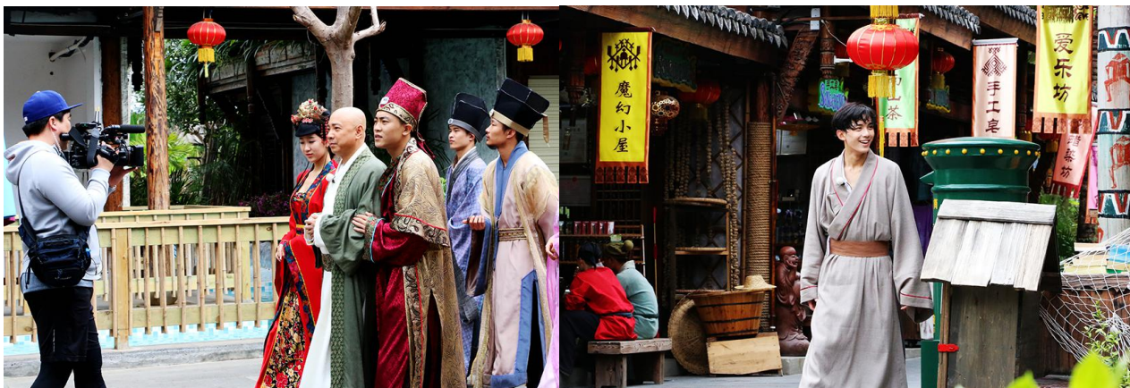
浙江卫视《二十四小时》在三亚千古情景区拍摄,众明星上演穿越之旅

报告期内,受经济环境、旅游结构调整及南海紧张局势的因素影响,三亚旅游市场整体陷入低谷。面临不利市场环境,三亚千古情景区深入市场调研,在产品销售中制定了特色的营销活动和创新的专题市场落地活动,加强终端市场的开拓力度,实现了远高于市场平均的整体营收增幅。东方卫视《极限挑战》第二季在三亚千古情景区开拍,黄渤、孙红雷、黄磊、张艺兴等极限男人帮在三亚千古情大剧院上演了一场豪华明星版《三亚千古情》,现场气氛火爆;春节期间,中央电视台少儿频道《过年啦》、中央四套、中央一套《新闻联播》也轮番对景区的新节目、少数民族过年方式进行了持续报道;浙江卫视《二十四小时》众明星玩穿越,三亚千古情景区成为国内热门综艺节目拍摄地。以上节目开播后反响热烈,极大提升三亚千古情景区的品牌。