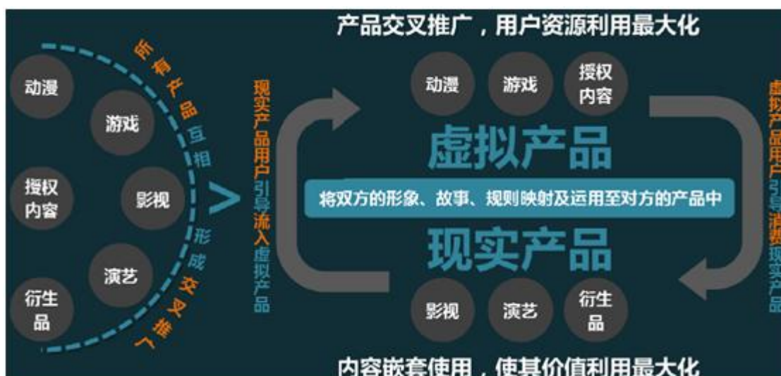
美盛文化平台生态