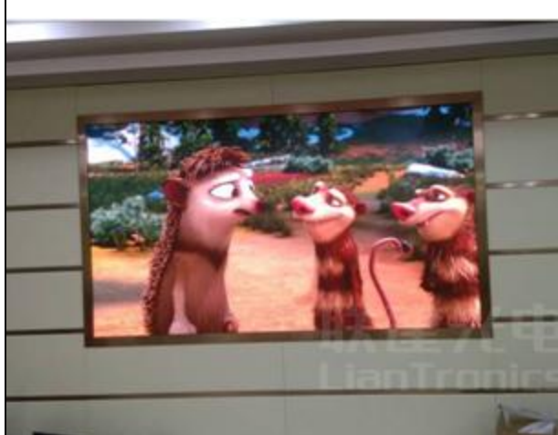
【项目名称】：黑龙江宁安县和合会酒店宴会厅V.me微密小间距大屏 【应用领域】：广电演艺 【产品像素】：PH4.8mm