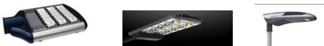
洲明第四、六代路灯及鲨鱼系列第三代单头路灯

公司是国内最早启动研发、制造LED路灯产品并提供解决方案的企业之一。对于路灯研发，公司大胆投入，坚持自主创新。公司从产品设计环节、检测环节、生产自动化环节来保证产品的可靠性，公司路灯数年来分别在结构设计、高效配光、智能调光、智能驱动三关键模块上保持着洲明路灯独有的核心竞争力。