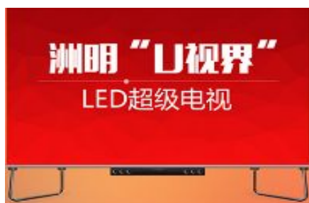
U视界标准商用超级电视

报告期内，公司推出“洲明U视界”——标准商用超级电视，以4K全高清画质、优异色彩表现、超长使用寿命、高效散热零噪音、严格对外电磁干扰等诠释洲明独家核心优势，可广泛应用于会议室、演播厅、机场、车站等公共场所显示及商务大堂、展厅、商场、品牌店以及家庭影院。洲明U视界自上市以来既获得客户垂青，目前此款商用超级电视已完全实现批量化与标准化生产，短期订单份额占UTV系列小间距产品的三分之一以上。