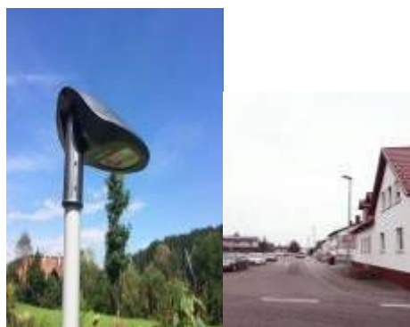
奥地利路灯项目30W/60W路灯项目