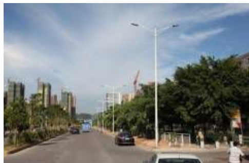
深圳市宝安区西乡LED路灯改造项目