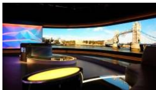
伦敦奥运会电视转播大厅 UTV项目

创新显示，智慧融合。 以小间距为代表的新一代LED显示屏的应用功能已不仅停留在单一的商用显示功能上，其作为一个不可或缺的信息流转关口，通过搭载各项专业系统，承载着水利、交通、安防、调度等各行各业对信息传播、反馈与加工的重要功能。洲明科技积极响应国家关于智慧城市、平安城市建设的号召，用实际行动履行社会责任与企业使命。公司已完成由单一产品供应商到“产品+方案”集成商的转