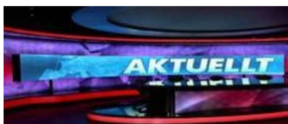
瑞典国家电视台内弧屏