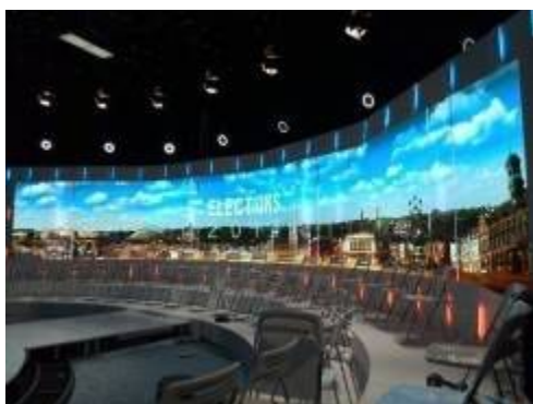
比利时某电视台 UTV1.9 (2014)

2014年度，小间距UTV系列产品实现收入约2亿元，较同期增长166%，其中，外销占比达60%，较同期增长约275%。鉴于渠道商业模式深远且可延续复制的特性，随着时间的积淀，该模式有望为公司带来快速、高效的订单响应速度，占领市场制高点并强有力提升公司盈利水平。