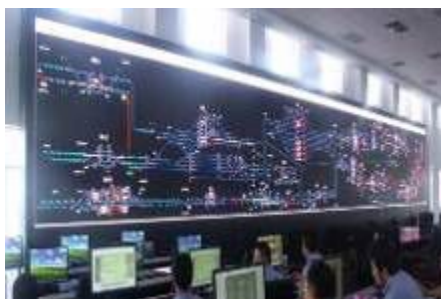
山西大同湖东站集控中心 UTV2.5

型升级，公司针对“智慧城市”能为客户提供完整的一系列节能且高效的完整解决方案，如：智慧安防系统、指挥调度系统、智慧交通系统、智慧城管系统、智慧矿山系统、定制化行业应用系统等，通过LED显示屏有效的监控和及时的信息反馈，真正的实现“智慧”控制。