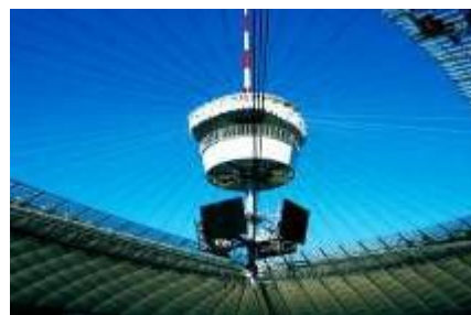
2012欧洲杯·波兰体育馆