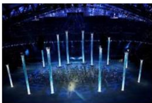
2014 索契冬奥会 216 根灯柱创意屏