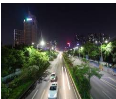
深圳市坪山新区LED路灯改造项目