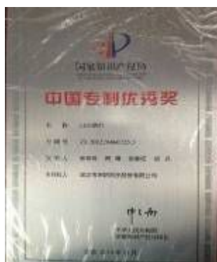
洲明路灯获2014中国专利优秀奖

公司路灯案例遍布祖国大江南北，享誉海外。在广深高速、长白山高速、川藏高速等著名项目中独占鳌头；在奥地利、澳洲、俄罗斯、伊朗、南非等多个海外市场占据着显著市场份额。报告期内，公司道路照明（含海外）接单金额为28,078.53万元。