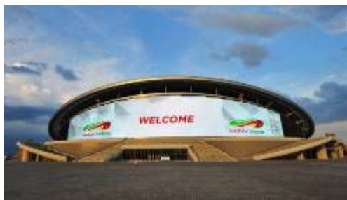
俄罗斯喀山大运会小云雀格栅屏 3700m 2

产品应用研发、设计、生产、销售和服务于一体的产品服务商，同时也是目前国内非上市公司中最大的LED产品应用系统解决方案服务商之一。本次收购是公司落实内生式发展和外延式发展战略相结合的战略举措。蓝普科技在LED显示领域有良好市场及行业沉淀基础，发展思路清晰；彼此优势互补，有助于整合双方在LED显示行业管理人才、国内外销售渠道、产品研发、生产以及供应链等资源，优化组织管理结构，在上市公司统一战略规划下，快速实现公司在LED显示各细分领域独特优势与国际领先地位。