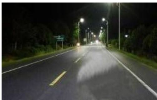
安徽黄山LED路灯项目