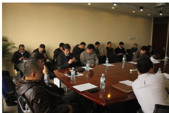
公司 2014 年度第一次临时股东大会召开现场