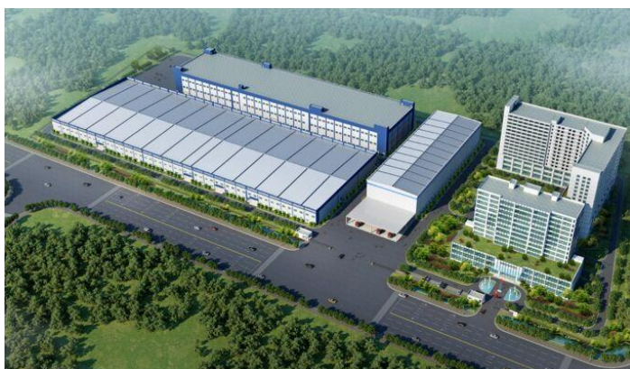
司米橱柜生产基地（效果图）