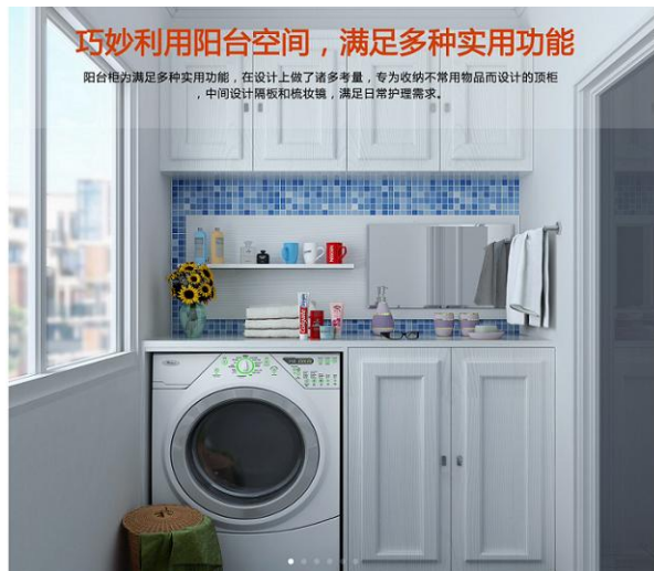
阳台定制收纳方案

(三) 携手法国知名厨柜SALM S. A. S. 公司，在华共同设立合营公司，经营国内橱柜业务