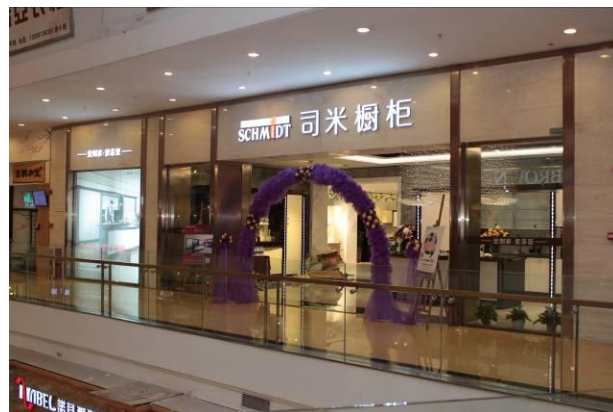
司米橱柜专卖店形象