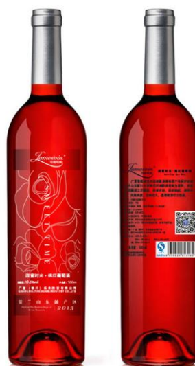
■ 詹姆斯酿 甜蜜时光桃红葡萄酒赤霞珠