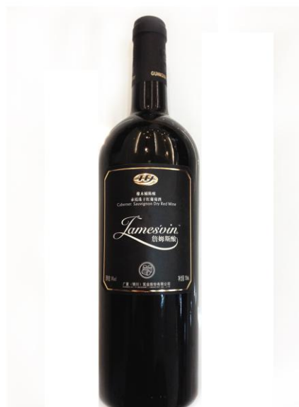
■ 詹姆斯酿 橡木桶陈酿赤霞珠干红