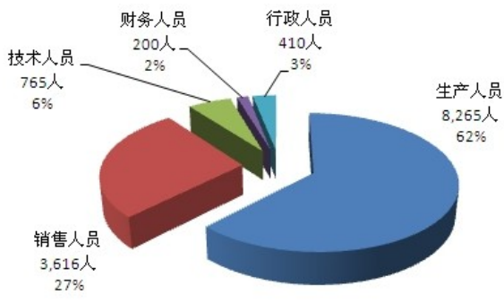
图 7.1 本公司员工专业构成类别情况图