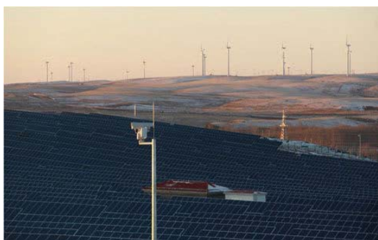
国家风光储输示范工程2MWh张北项目

针对国内外户用储能领域，公司推出了铅炭电池及锂电的差异化解决方案，以满足不同用户的需要，在非洲、中东及欧洲等地积极推广小型户用储能系统并在报告期内实现规模销售。近几年，海外的户用储能市场已日趋成熟，其中，德国2013年和2014年两年共计划投资5000万欧元，对新购买储能系统的用户直接进行补贴；日本将推动户用储能作为产业扶持的重点，2012年4月出台家庭储能系统补助金政策，这些均有力地促动了户用储能市场的发展。公司将抓住国内外户用储能市场机会，继续积极拓展该市场。