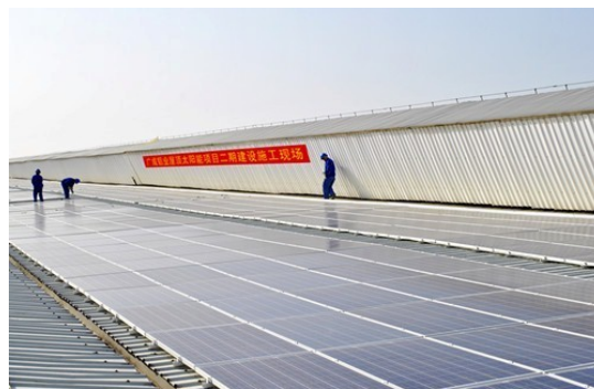
广东电科院广成铝业1.5MW的863蓄能项目