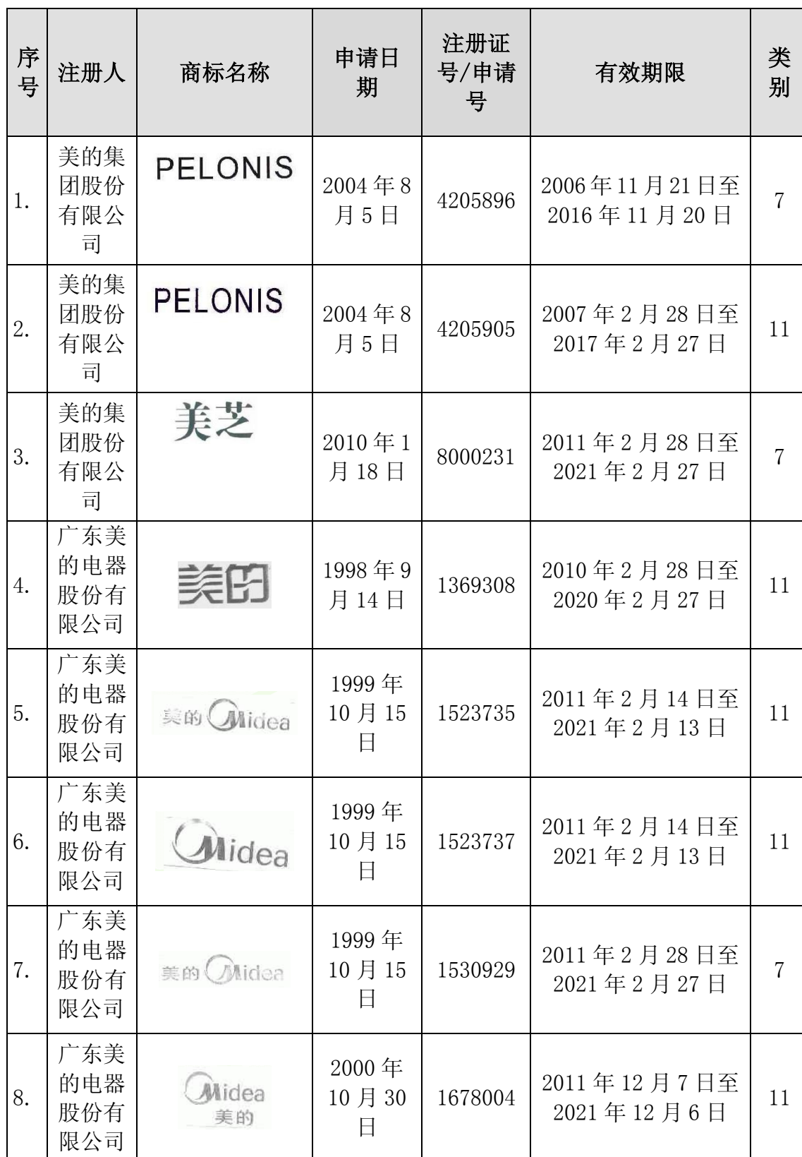
附表八：美的集团及下属公司自有主要商标一览表