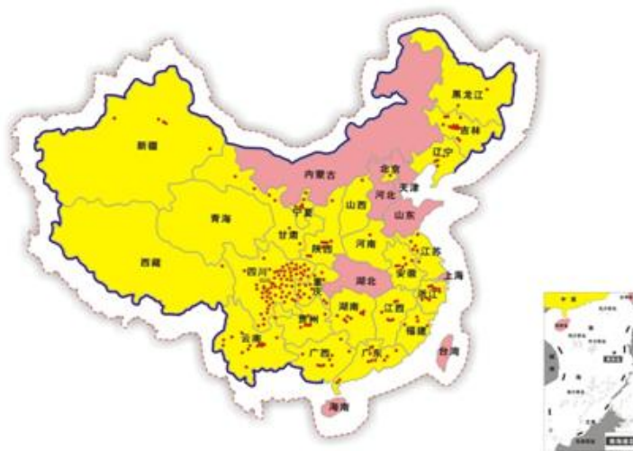
2012年全国直营连锁店分布示意图

报告期内，公司进行适度扩张，扎实稳妥地推进实施“星火”战略计划，构建全国市场网络布局。根据经营效益，结合当地市场发育条件，推动开展针对部分市场的“扶优汰劣”为指导思想的网络结构和规模的清理优化工作，进一步优化公司主营业务质量。通过投资直营店建设，实现店面数量同比上年增长8.87%，近三年开店实现17.53%的年均复合增长速度。