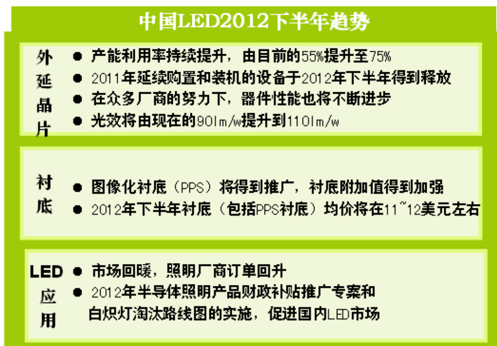
图表 1: 中国 LED2012 下半年趋势

2011 年受 LED 产品需求波动及产能大幅扩张的影响, LED 产品价格出现大幅下滑, 整个产业盈利能力也出现了较大幅度的下滑。从目前来看, 随着背光和照明市场需求的恢复, LED 需求开始逐步企稳, 价格下降速度也有所缓解。从台湾 LED 板块的经营状况来看, 4 月芯片、封装和背光模组营收环比增速分别为 5%、1%和 1%; LEDinside 统计 4 月台湾 LED 封装厂产能利用率达到 80%-90%, 均体现出产业需求逐步企稳的趋势。