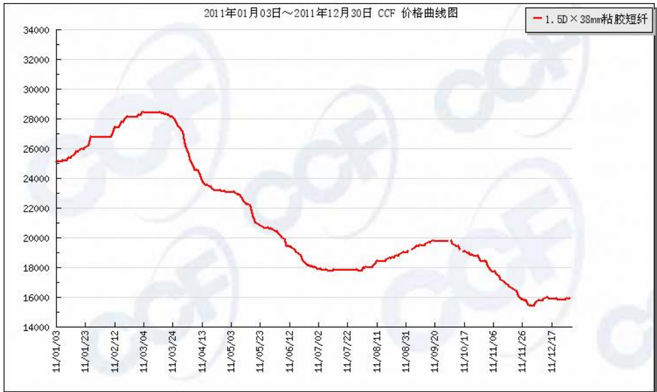
图：2011粘胶短纤价格走势

2011 年粘胶短纤行业受到国内外宏观经济形势等因素的影响，粘胶短纤价格较之往年波动加剧。行业处于复杂的市场环境下，对不同环境市场节奏把握的难度也随之加大。