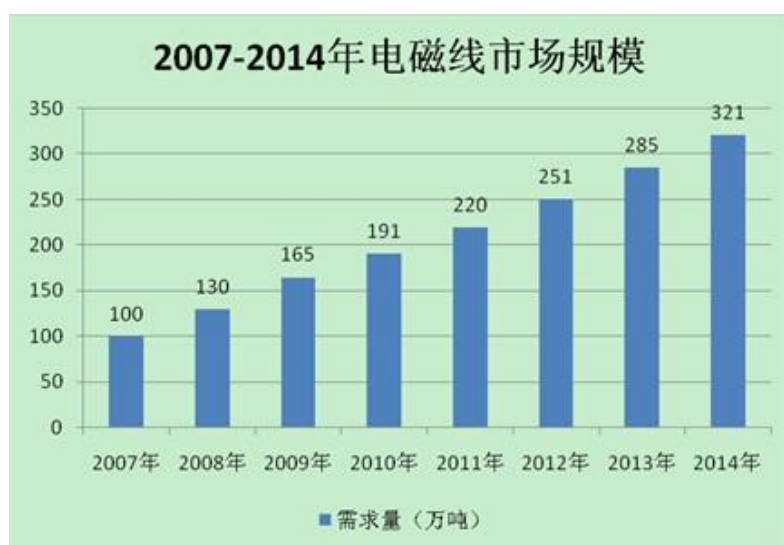
我国近年电磁线市场容量及预测

我国电磁线行业起步较晚，但市场空间较大，人工成本较低，从而使电磁线生产企业获得快速发展。厂家在这一阶段通过引进先进的设备和技术，并通过自主研发取得技术突破，逐步拉近了与先进工业国家的技术差距。受大规模电网建设、机电行业、以家电为主导的新兴行业和以电子信息为主体的高科技行业以及经济全球化等因素的联合拉动，国内电磁线行业持续高速发展。