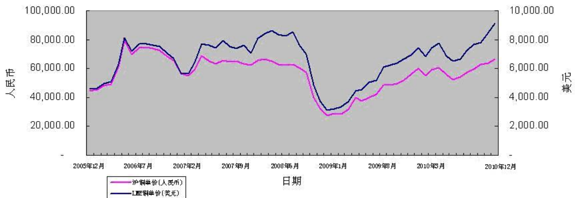
国内外铜价比较图

公司主要原材料为黄铜（铜含量 59%左右、锌含量为 39%左右），报告期内，公司铜棒及铜配件等主要原材料占入库产品成本的比例平均为 80%以上。黄铜的价格主要受国际铜市场价格的影响较大，以国内外铜期货交易所的现货价格为例，2006 年以来的铜价走势图如下：