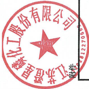
江苏澄星磷化工股份有限公司2024年度非经营性资金占用及其他关联资金往来情况汇总表