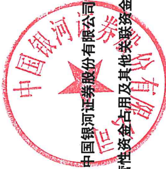
2024 年度非经营性资金占用及其他关联资金往来情况汇总表