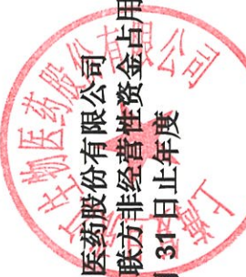
上海复旦张江生物医药股份有限公司 控股股东及其他关联方非经营性资金占用及其他关联资金往来情况汇总表 (续) 截至 2024 年 12 月 31 日止年度