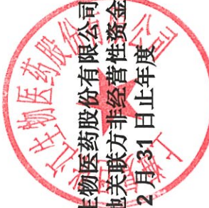
上海复旦张江生物医药股份有限公司 控股股东及其他关联方非经营性资金占用及其他关联资金往来情况汇总表 截至 2024 年 12 月 31 日止年度