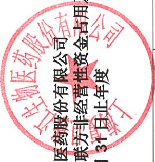
上海复旦张江生物医药股份有限公司 控股股东及其他关联方非经营性资金占用及其他关联资金往来情况汇总表 (续) 截至 2024 年 12 月 31 日止年度