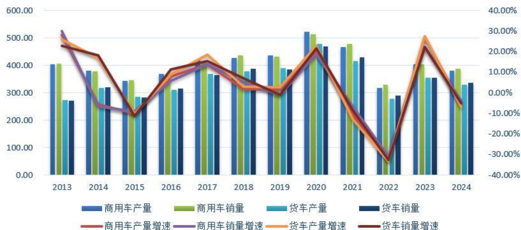
图1 2013年-2024年我国商用车、货车产销量及增速 单位：万辆

2018 年，各地区各部门认真贯彻落实党中央国务院决策部署，按照推动高质量发展要求，深入推进供给侧结构性改革，积极落实稳就业、稳金融、稳外贸、稳投资政策，经济运行在合理区间，继续保持总体平稳、稳中有进发展态势。全年共产销商用车 427.98 万辆和 437.08 万辆，同比增长 1.69%和 5.05%。