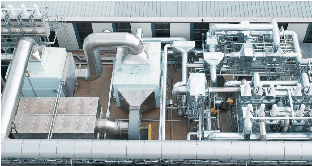
浙江坤孚 DMF/甲苯 DMF 有机废气溶剂回收项目

公司自主研发的有机废气治理兼溶剂回收装置，采用先进的“沸石转轮吸附+氮气脱附+废气干燥+废气深冷”工艺，通过双级转轮吸附设备，脱除其中的有机 VOCs 成分，并对高浓度有机废气进行低温冷凝回收，得到不含水的有机溶剂，在做到达标排放的同时实现了有机废气的综合化利用。