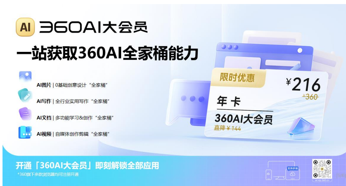
■ 图：360AI 办公

截至 6 月 30 日，“360AI 大会员”自 4 月 18 日正式发布已累计超 15 万在途用户，单日收入超 10 万元。后续，360AI 大会员会持续扩展新产品、新权益，打造 PC 端付费用户规模最大、权益覆盖最广、性价比最高的会员体系。