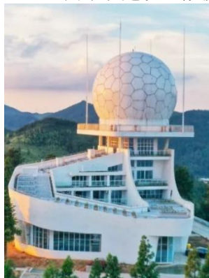
S 波段双偏振相控阵天气雷达

处理应用的整体解决方案。公司延承我国雷达工业血脉，主动承担“中国雷达走向世界”的重任，积极响应“一带一路”倡议，与合作伙伴建立了长期业务关系。推动技术创新，开展科技攻关，将新一代雷达技术成功应用于民用雷达领域，攻克大型相控阵天气雷达技术，积极开展 X 波段相控阵测雨雷达及应用系统的研制，持续引领气象雷达技术的发展；基于物联网、人工智能与大数据分析等技术，率先谋划“雷达+系统”整体解决方案布局，为气象防灾减灾提供有力支撑；在二次雷达 S 模式协同监视与数据链、雷达信号处理、大数据挖掘等多个领域持续开展技术攻关，确保在空管雷达装备与系统领域保持技术领先优势。公司是国内微波电路、组件设备和特种电源的重要供应商，主要业务涉及雷达装备、民用通讯、电子战、安检安防等领域。公司加快布局发展低空经济、商业航天等战略性新兴产业，积极开展低空经济整体解决方案论证，承接了我国风云系列气象卫星地面系统建设，微波器件产品已在星网系统建设中得以应用。