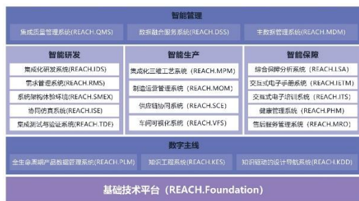
智能制造基础数字平台

公司围绕产品全生命周期主线打造丰富的工业软件产品组合，为用户提供智慧企业整体解决方案，在航空、航天、船舶、国防电子、兵器、核能、汽车、民用电子等行业 400 余家企业的多个重点装备研制生产和服务保障中成功应用。通过核心产品（工业软件、智能装备）、多层次解决方案（智能车间、智慧企业、制造云服务）的并行推进和融合发展，全面满足企业数字化、网络化、智能化的转型需求。公司帮助工业企业利用信息技术打造高效顺畅的产品全生命周期数字链，并通过自身的技术和服务，将领先的智能制造理念和最佳实践融入信息化系统中。持续加强系统工程建模、数字孪生、虚实仿真等现代信息技术与先进制造业技术的深度融合，积极探索核心产品国产化替代路径，拓宽产品谱系，在现有业务基础上，布局平台类、设计类等相关新型工业软件。公司凭借出色的创新能力打造了自主工业软件品牌 REACH 睿知和智能制造装备品牌 REASY 睿行系列产品，为离散型制造业的转型升级和提质增效提供有力支撑，致力于成为中国领先的“智慧企业解决方案及自主工业软件提供商”。