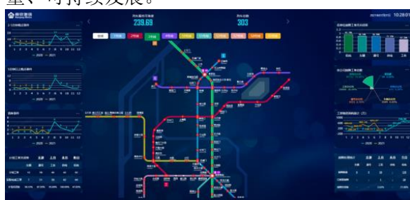
地铁设备设施综合运维平台

公司面向智慧城轨在智慧运输组织、智能列车运行、智能运维安全、智慧网络管理等方面的建设需求，公司推出数字化智慧轨交产品，利用 5G、云平台、大数据、探测感知等技术，实现列车运行更智能、运维管理更智慧，驱动轨道交通进入智能化的高质量发展轨道。公司以信号系统为核心，持续进行新一代自主信号技术产品迭代升级，提升列车运行安全与效率，降低能耗；同时推进轨道交通产品信息化、智能化应用，带动轨道交通产业数字化转型升级，提高轨道交通产业智能化水平；加快自主研发布局，围绕探测感知、信息安全核心技术攻关，实现国产化产品替代，致力成为轨道交通信号和信息化系统解决方案核心供应商和服务商，实现轨道交通产业高质量、可持续发展。