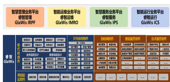
全自主智慧城轨技术平台