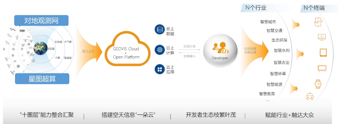
图 3-1 星图云技术路线

报告期内公司研制并发布了星图云开发者平台，全面提升了数字地球能力。星图云是在线数字地球战略的延续，是进一步整合资源、能力、服务和运营的产品集合。基于空天信息产业链多圈层能力，搭建“空天信息一朵云”，通过“平台+生态”模式，构筑更加繁荣的全场景开发者生态，让空天信息能力赋能千行百业，触达大众。