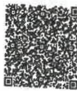
四川省注册会计师协会 已年检二维码

本证书经检验合格; 继续有效一年。 This certificate is valid for another year after this renewal.