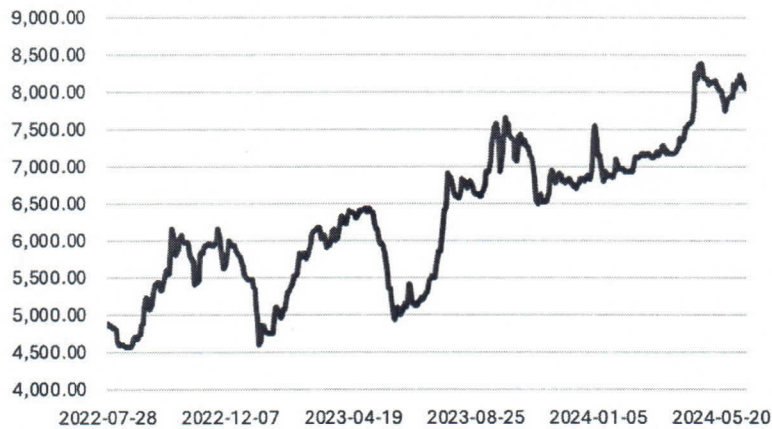
丙酮价格走势图中

为明显。2023 年丙酮价格处于高位，下半年呈大幅上涨趋势，公司平均采购价格上涨了 12%，具体变动如下图所示：