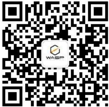
黄蜂 T800 多场景智能制暴器及产品公众号