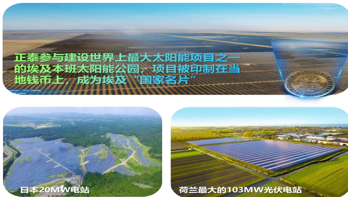
图 14：全球建成多座地面光伏电站项目