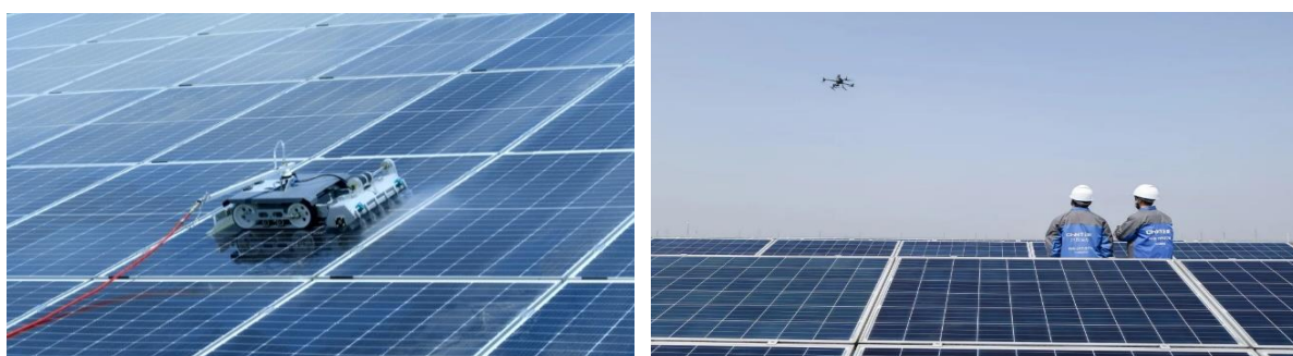
图 10：正泰安能智能化运维

可控；持续进行流程与数字化转型，打造数据指标综合看板、全流程数字化质量管理平台及运维管理平台，指导现场工作，提高电站资产管理质量和效率；开展“南泥湾行动”，从材料、施工、运维等方面着手，有效落实成本控制，提高电站收益率；加强行业标准引领和质量支撑，主导或参与了多项地方行业标准制定工作，为国家能源局发布的《户用光伏电站合作开发合同（范本）》《户用光伏建设运行百问百答》《户用光伏建设运行指南》等提供关键内容。