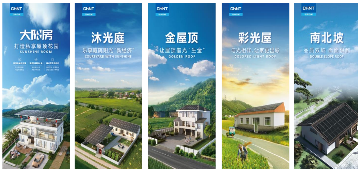
图 11：正泰安能户用分布式光伏场景方案

解决方案，为用户量身打造“多快好省”品质电站。在行业跃升的关键时期，正泰安能创新升级并融合“比特”与“瓦特”，建立了完善的全生命周期信息化管理系统，实现电站资产运营效率和运维管理效率的双提升，推动户用光伏率先成为高质量发展的新兴产业典范。