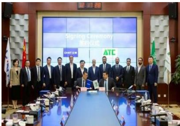
图 5：正泰与沙特 ATC 签署战略合作协议