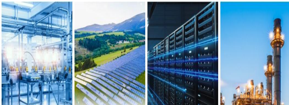
图 1：分行业解决方案

新活力。凭借完整、高性价比的产品线布局，产品研发、智能制造、快速响应体系以及全产业链优势，尤其是在 5G&通讯、新能源、流程工业领域，推出行业领先的系统解决方案及系列产品，以满足市场对高端化、智能化低压电器的需求，报告期内，公司市场份额显著增长，为公司业绩增长增添新动力。