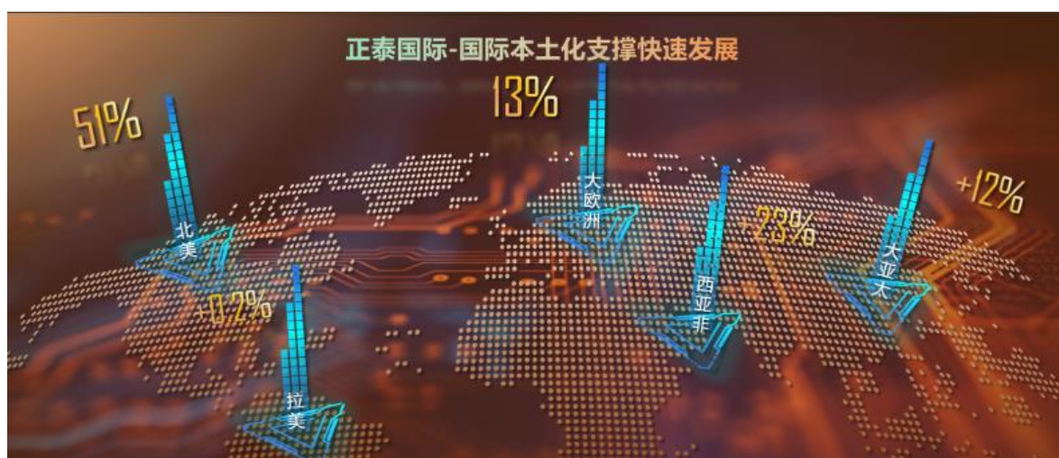
图 4: 正泰国际分地区收入增速情况

报告期内,公司加速推进以区域总部和本土化子公司为核心的全球业务架构体系,本土化国家公司累计达 30+,本土化率达 65%;持续推进全球渠道倍增及战略大客户合作,新增渠道商 40+,不断加强与全球头部客户的合作,全球活跃渠道与项目客户达 2,000 余家,实现全球 140 多个国家业务覆盖。公司国际业务实现营业收入 44.69 亿元,同比增长 16%。其中,大亚太地区收入同比增长 12%;大欧洲地区收入同比增长 13%;北美地区收入同比增长 51%;西亚非地区收入同比增长 23%;拉美地区收入与同期保持持平。