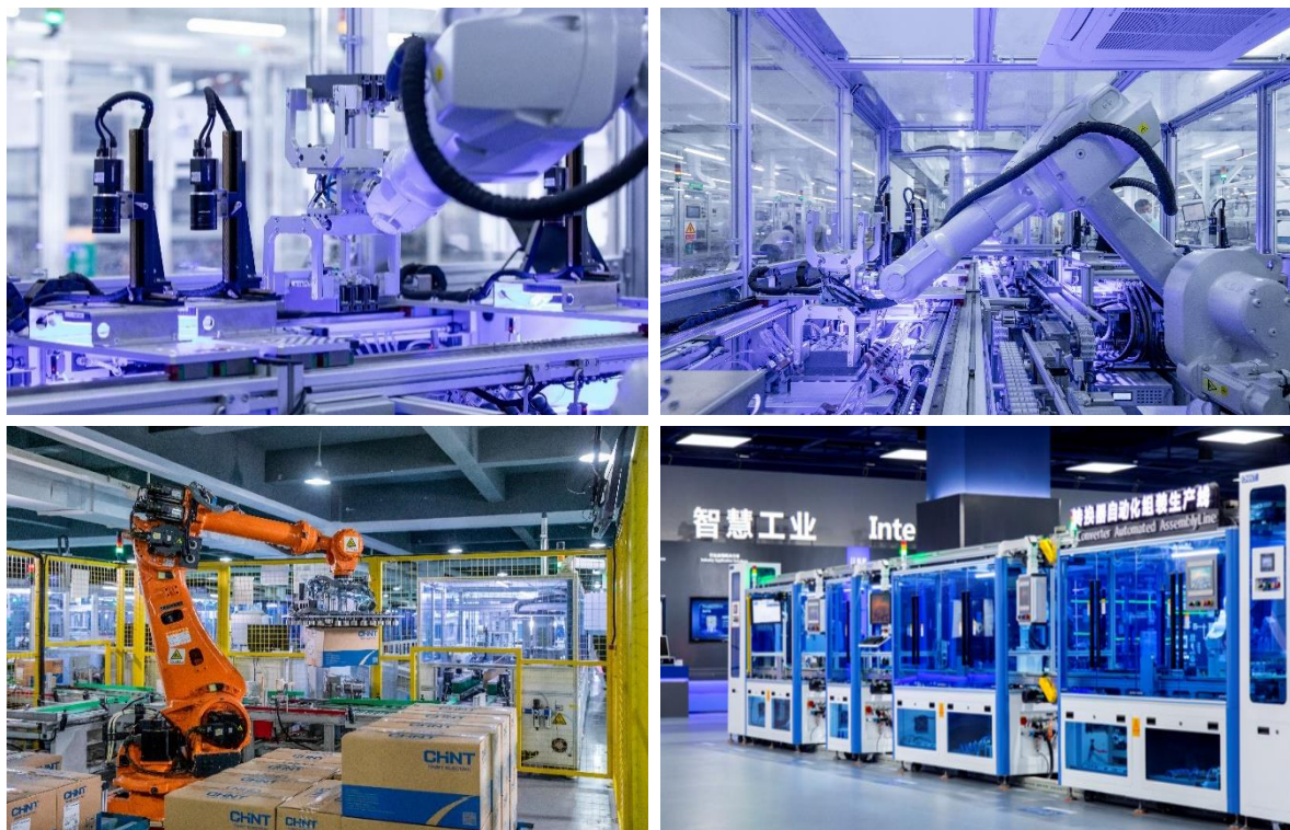
图 3：正泰定制开发智能制造装备

报告期内,正泰电器凭借在践行信息技术与制造技术全产业链深度融合方面的卓越实践,荣获国家工信部“数字领航”示范企业,成为低压电器行业唯一入选的企业,再次彰显出行业“龙头”的实力与担当。