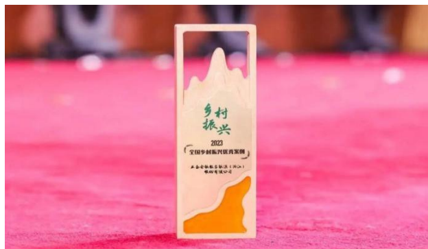
图 12：正泰安能获评“2023 全国乡村振兴优秀案例”