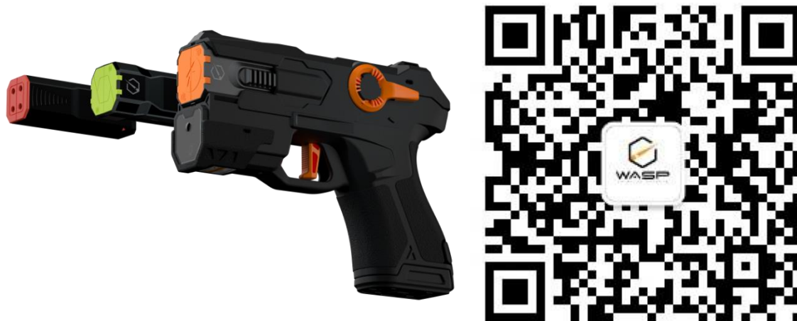
黄蜂 T800 多场景智能制暴器及产品公众号

公司结合一线禁毒服务经验及警用装备需求，自主研发了多场景智能制暴器黄蜂 T800，该产品集视觉干扰、嗅觉刺激、物理束缚、肌肉刺激等功能于一身，可通过快速换弹实现复杂环境下的多种制伏方式的连续击发，同时兼具影音取证、后台监管、防抢防盗等功能。该产品可大量配备于一线民警，增强一线人员的执法能力，大幅提高执法效能和执法安全性，填补了我国在维稳、处突等领域的应用空白，有助于提升公司的核心优势及市场竞争力。