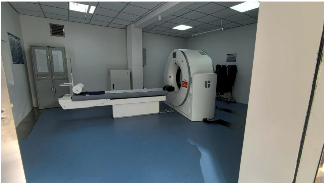
京沪高铁公司捐赠的国产 16 排 CT 设备

公司建立与西安局集团公司、勉县有关部门定期对接沟通机制，及时解决项目推进过程中难点、堵点问题，有效凝聚起路地联合、共促振兴的工作合力。