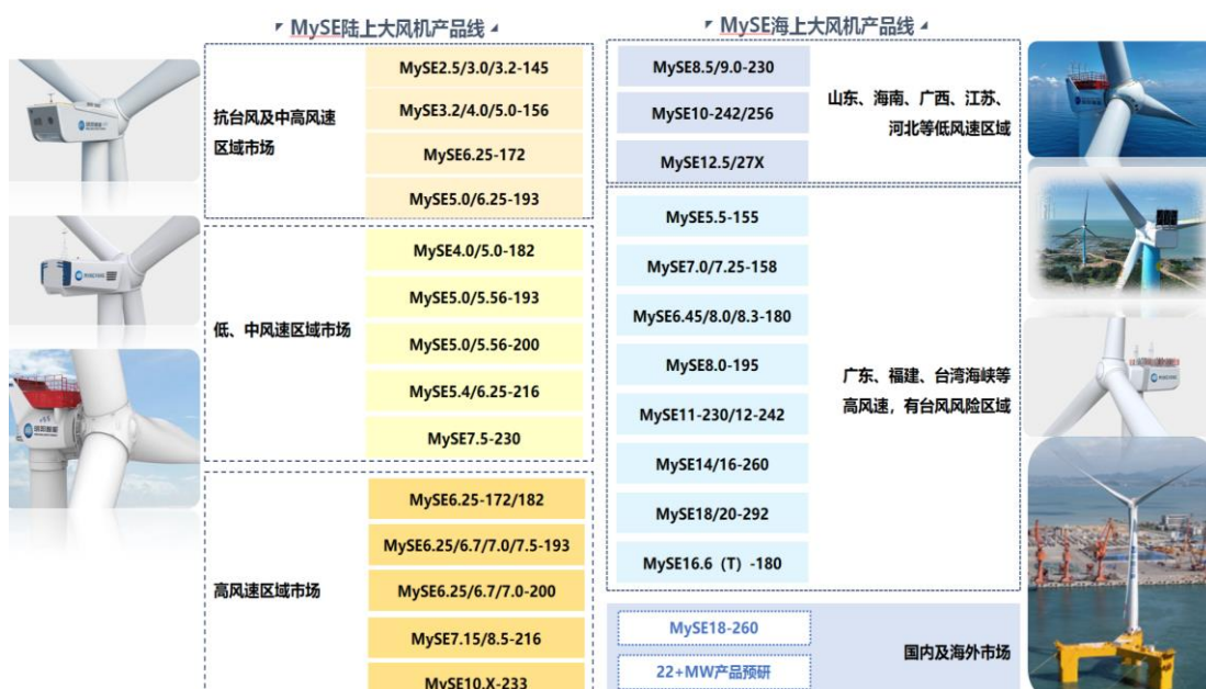
图：明阳智能风电整机产品线

公司风电整机制造板块包含大型风力发电机组及其核心部件的研发、生产、销售等业务。针对世界各地的不同风况和气候条件，包括低温、沙尘、台风、盐雾、高原等严酷环境，公司研发和设计了适应不同特殊气候条件的陆上和海上风机，形成了“覆盖当前、着眼未来”的多产品布局，包括单机功率覆盖 1.5-11MW 系列陆上型风机和单机功率覆盖 5.5-22MW 系列海上型风机。每个系列的风机又包含不同叶轮直径，适应不同地域、不同自然环境的风况特点。在同一叶轮直径基础上，公司根据不同环境条件推出了常温型、低温型、超低温型、宽温型、高原型、海岸型、抗台风型、海上型、海上漂浮式等系列机组。公司目前是国内风力发电行业产品品类最为齐全，布局最具前瞻性的领军企业之一。