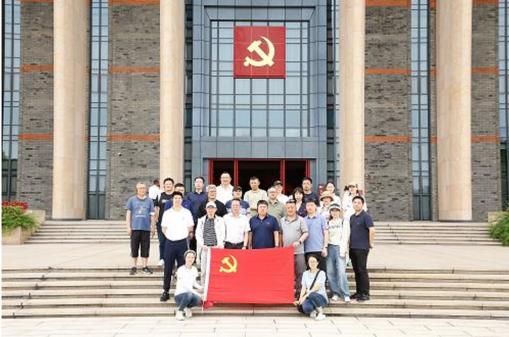
图为公司职工参加嘉兴南湖活动

2023 年度，公司积极开展职工文化宣传教育活动，工会与党委联合组织举办了为期 2 天的“不忘初心、重走一大路”，赴中国革命的起源地、中国共产党的诞生地嘉兴南湖主题教育研学职工活动，这次活动党员群众们对中国共产党革命历史有了更为深刻的理解，纷纷表示受到了一次深刻的学习教育和灵魂洗礼，获得了党员及群众的一致好评。