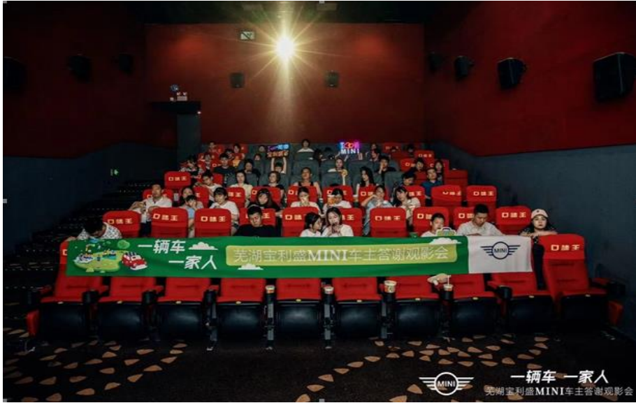
图为芜湖宝利盛开展客户观影及儿童交通安全训练营活动

2023年5月13日，MINI大东区伙伴会议在山城重庆举办，在这巴山蜀水之中共同见证2022年度优秀经销商伙伴们的荣耀时刻。作为皖南地区唯一双品牌（BMW & MINI）授权经销商，芜湖宝利盛一直不惧挑战，追求卓越，以优异的销售业绩、服务品质和管理水平获得广大客户的认可，并荣获“MINI东南区2022年经销商运营管理最佳经销商”。