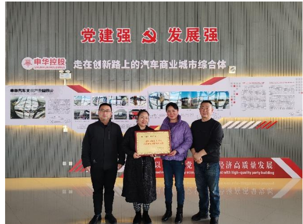
图为渭南汽博园参加公益互助和为青海捐款活动