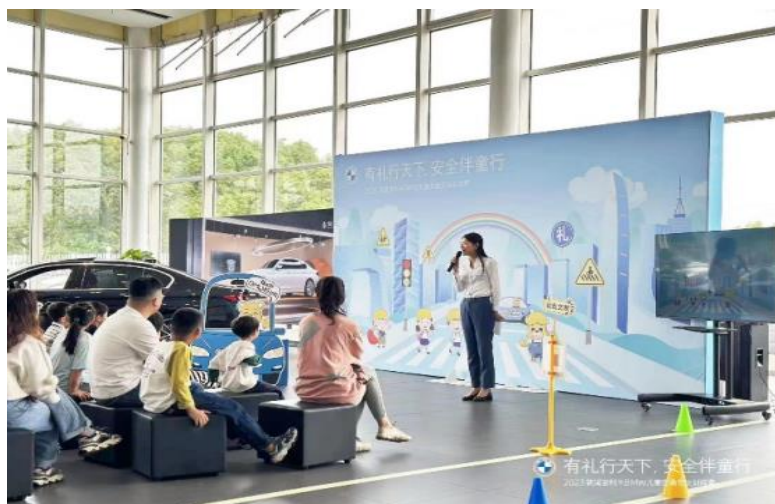
图为慈溪宝利丰儿童交通安全训练营

为提升孩子们的交通安全意识，增强日常规避风险的能力，2023 年 10 月，慈溪宝利丰为宝马车主及孩子举办了一场“有礼行天下，安全伴童行”儿童交通安全训练营，号召小朋友和家长在学习交通安全知识，遵守交通安全法规的基础上，积极践行乘车之礼，开车之礼，行人之礼，树立交通“礼貌”的新意识。