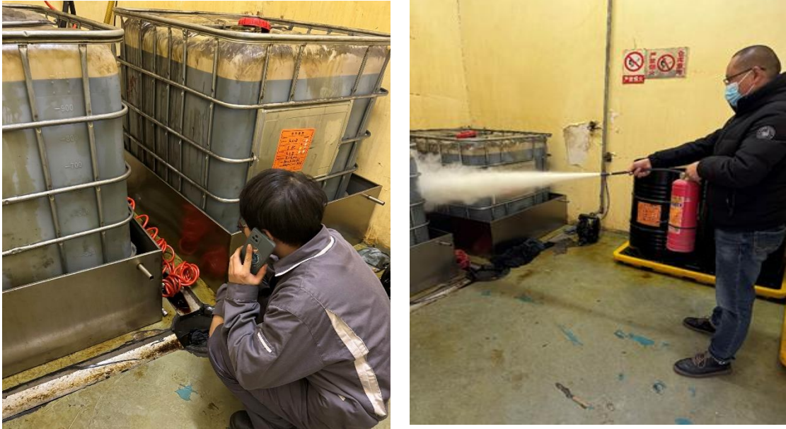
图为宜兴宝利丰为员工安全检查和消防演练活动

2、渭南汽博园设有环境管理部门，配合区域环保部门，全面负责园区及入园企业的污染治理、污染监督检查及环保宣传教育工作。园区定期对入驻汽博园区的各类品牌进行检查及环境保护知识宣传，针对产生的废物、废水来源及治理方法，对可能出现的污染事故进行讲解科普。对建设中的项目严格落实主体责任，对各阶段严格落实环境保护措施，配合做好环境监理与监测，为企业与客户营造一个绿色安全的园区环境。