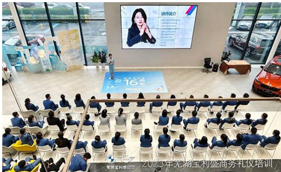
图为芜湖宝利盛邀请专业形体礼仪老师为员工培训礼仪礼节

考核方面，2023年以来，公司业绩与收入强挂钩，依据业绩指标严格考核，组织签订2024年度业绩责任书，结合员工职位说明书及每年重点工作侧重情况制定个人绩效指标。通过季度指标完成情况跟踪，及时找出需要调整或改进的事项。在年度考核中视日常职责及重点工作完成情况进行评价，并将评价结果与奖金挂钩。考核结果将逐一反馈至每一位员工，帮助其改进成长，为来年的绩效突破做好准备工作。