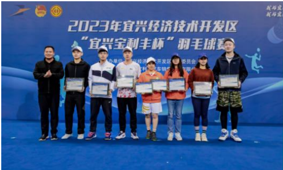
图为“宜兴宝利丰杯”羽毛球比赛现场