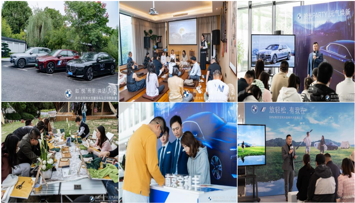
图为南京宝利丰组织的客户回馈活动

2023 年，南京宝利丰为回馈客户，陆续组织开展了大型豪华车车主中秋家宴如“悦”而至共话团圆活动、“有我在，放轻松”皖南风光探境之旅、“拾光 PARTY，元气焕新”春季车主关怀等多项活动，与车主们共度佳节，共享美景。