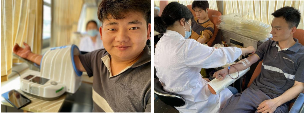
图为东阳宝利丰员工积极参加无偿献血

2023 年，东阳宝利丰所在街道组织了无偿献血活动，东阳宝利丰数名员工响应号召，积极参与其中，奉献出自己的一片热血和爱心。