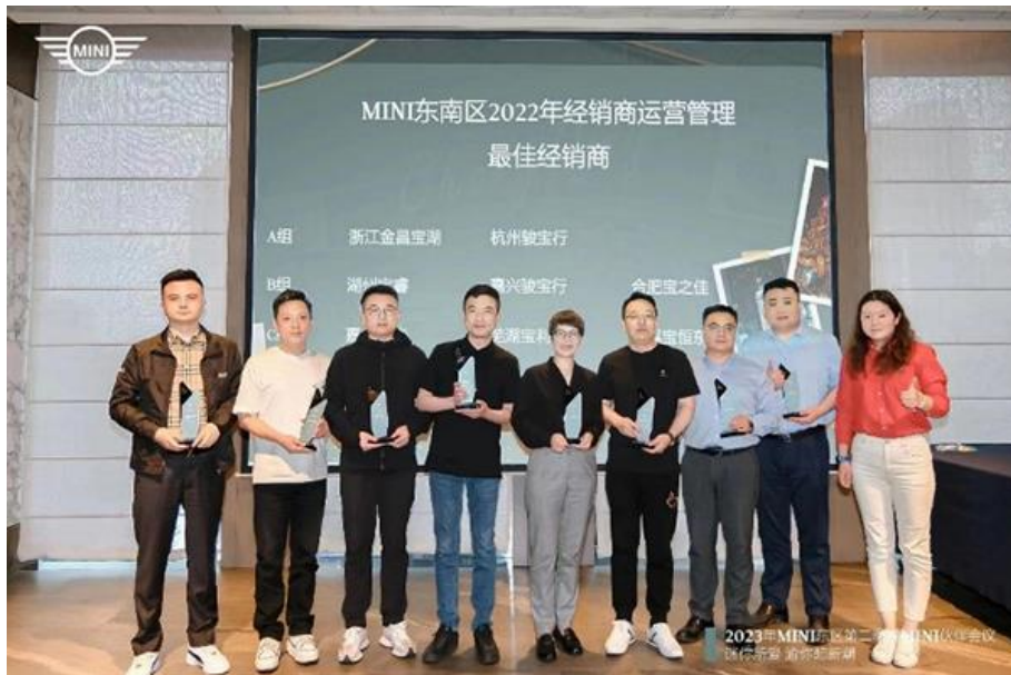
图为芜湖宝利盛获得2022年度MINI东南区最佳经销商

2023年5月13日，MINI大东区伙伴会议在山城重庆举办，在这巴山蜀水之中共同见证2022年度优秀经销商伙伴们的荣耀时刻。作为皖南地区唯一双品牌（BMW & MINI）授权经销商，芜湖宝利盛一直不惧挑战，追求卓越，以优异的销售业绩、服务品质和管理水平获得广大客户的认可，并荣获“MINI东南区2022年经销商运营管理最佳经销商”。