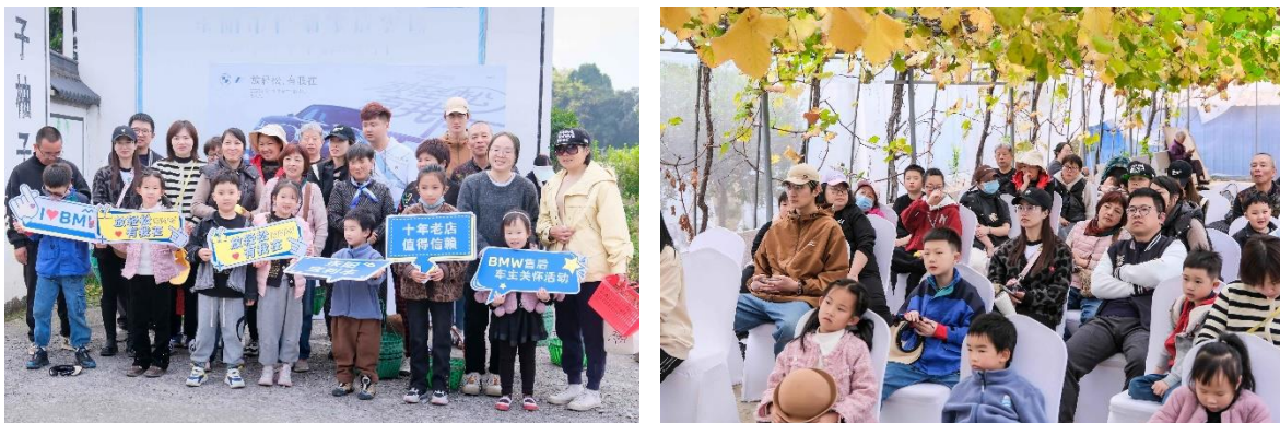
图为东阳宝利丰车主关怀活动

2023年11月26日，东阳宝利丰组织车主在东阳松菊家庭农场开展放轻松、有我在——2023东阳宝利丰车主关怀活动，邀请车主家庭一起共赏田园秋色，共度美好时光。