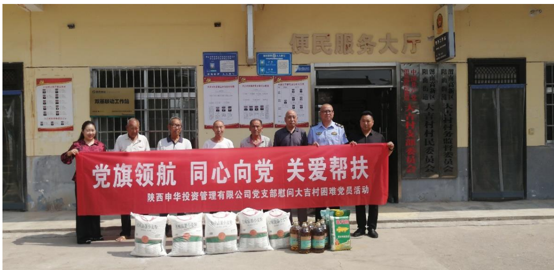
图为渭南汽博园党支部慰问大吉村困难党员

2023 年 6 月，渭南汽博园联合渭南市高新区非公党委在大吉村开展了以“党旗领航 同心向党 关爱帮扶”为主题的困难党员慰问活动，为广大困难党员送去了米面油等慰问品。12 月，汽博园党支部参加了抗震捐款，尽绵薄之力为青海受灾群众捐款 1000 元。