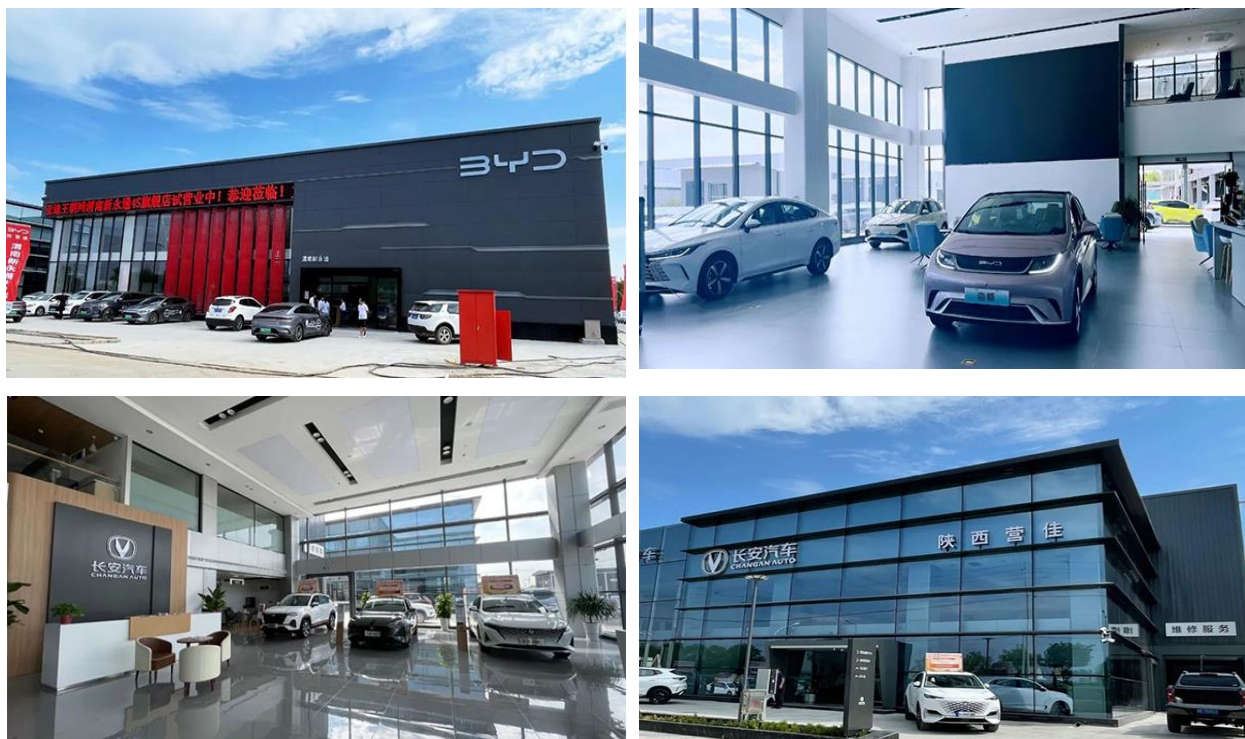
图为渭南汽博园比亚迪及长安汽车 4S 店

渭南汽博园和开封汽博园是公司旗下的两家综合性的汽车文化博展园，服务好园区企业和消费客户是园区经营团队的首要责任。渭南汽博园开业较早，目前经营业态更为完善，入驻品牌方面，梅赛德斯-奔驰、一汽丰田、广汽丰田、广汽传祺、广汽本田、长安马自达、红旗、比亚迪海洋网、比亚迪王朝网、上汽大众、长城、哈弗、哈弗新能源、吉利、荣威、五菱宝骏、长安汽车等 20 余汽车 4S 店均已开业，特斯拉钣喷中心已投入使用，申华二手车交易市场、商用车交易市场均已开放运营。