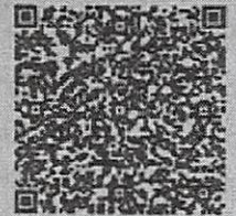
肖菲的年检二维码