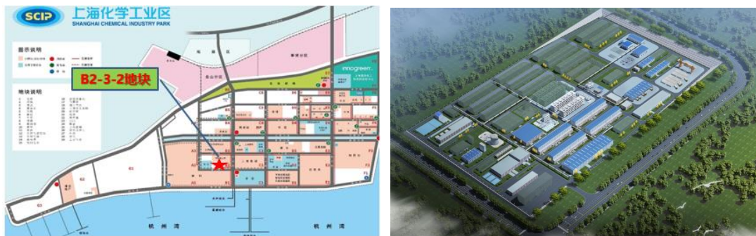
图2：上海子公司地块及呼和浩特子公司效果图

2024年2月，为优化完善产能布局，提升行业竞争力，中船特气投资34,000万元设立中船派瑞特种气体(呼和浩特)有限公司(以下简称“呼和浩特子公司”)。利用当地资源优势，呼和浩特子公司拟投资136,300万元(最终投资金额以项目建设实际投入为准)建设高纯电子气体项目(一期)，用于新增年产7,500吨三氟化氮、10,000吨超纯氨气、75,000吨液氮的生产能力。目前呼和浩特子公司已完成土地出让等流程，2024年将按计划推进建设工作。