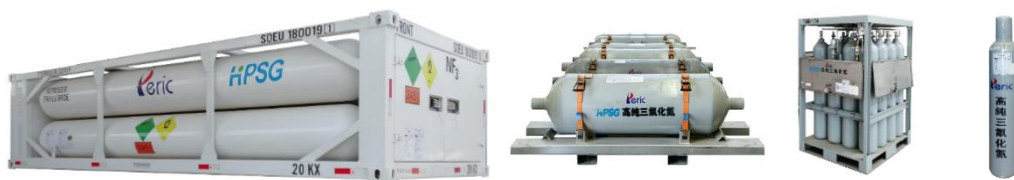
图 1：三氟化氮产品（包装容器为管束式集装箱及钢瓶）

中船特气主营业务为电子特种气体及三氟甲磺酸系列产品的研发、生产和销售。2023 年，公司实现营业收入 16.16 亿元，其中电子特气收入占比 91.94%。