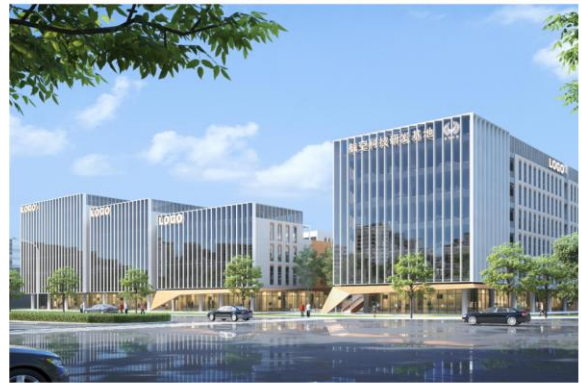
航空科技研发基地项目效果图