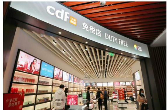
三亚凤凰机场免税店