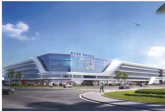
航空特货超级运营人项目效果图

此外，公司积极参与海口江东新区开发，培育打造临空产业新业务，谋划推动海南自贸港大封关航空物流及加工产业示范基地项目落地，项目一期占地约 276 亩，将建设航空特货超级运营人、航空科技研发基地、航空物流公共服务中心和航空 OEM 高端制造四个产业项目，助力海南自由贸易港形成“以机场流量带动空港产业、以空港产业促进区域发展”的模式。