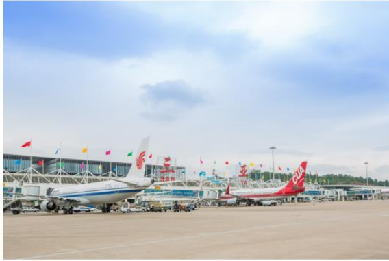
三亚凤凰国际机场