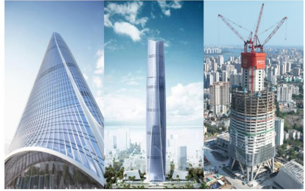
海南中心效果图、实拍图

此外，公司积极参与海口江东新区开发，培育打造临空产业新业务，谋划推动海南自贸港大封关航空物流及加工产业示范基地项目落地，项目一期占地约 276 亩，将建设航空特货超级运营人、航空科技研发基地、航空物流公共服务中心和航空 OEM 高端制造四个产业项目，助力海南自由贸易港形成“以机场流量带动空港产业、以空港产业促进区域发展”的模式。