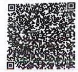
吴震东年检二维码

本证书经检验合格，继续有效一年。 This certificate is valid for another year after this renewal.