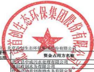
2023年度非经营性资金占用及其他关联资金往来情况汇总表