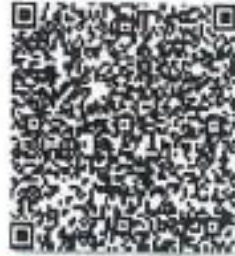
清晰的年检二维码.png

本证书经检验合格，继续有效一年。 This certificate is valid for another year after