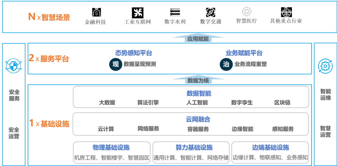
行业数字化架构图

公司的主营业务包括数字化产品、行业数字化和数字新基建等三大业务板块，通过深入推进大数据、人工智能、物联网等新一代信息技术与业务融合创新，持续构建“1+2+N”行业数字化架构体系，打造行业数字化整体解决方案头部企业。在主营业务相关板块，公司享有受客户尊重的品牌与口碑、突出的行业地位和较强的行业影响力。