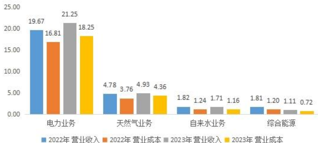
分行业经营情况（单位：亿元）