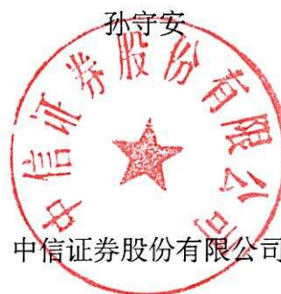
中信证券股份有限公司