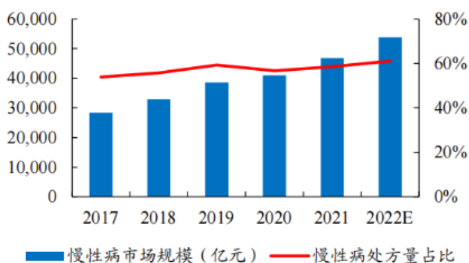
图 1: 2017-2021 年中国慢性病市场规模持续增长

中国人口老龄化程度不断加深，心脑血管疾病、糖尿病、恶性肿瘤等慢病的发病率随之上升，慢病患者基数不断扩大，慢病防控形势渐趋严峻。尽早介入慢性病治疗管理、干预慢性病恶化、降低慢性病致死可能性已渐成当下健康发展的主要需求。随着中医学诊疗体系与现代生物医学模式的不断发展和相互渗透，中医药在慢病防治中的作用和应用越来越受到重视。在病程长、发病率高、治疗效果不理想的慢性病防治中，中医药可以延缓病情进展、减轻患者症状。随着中医药在治未病、辨正施治方面逐步被社会大众认可，无论是中老年人，还是青壮年人群，都更加重视慢病诊疗及中医养生，这一观念的转变将推动中药 OTC 市场的发展。在移动互联网快速发展、网上药店快速扩容的背景下，具有 OTC 品牌优势的企业将迎来更多发展机遇。