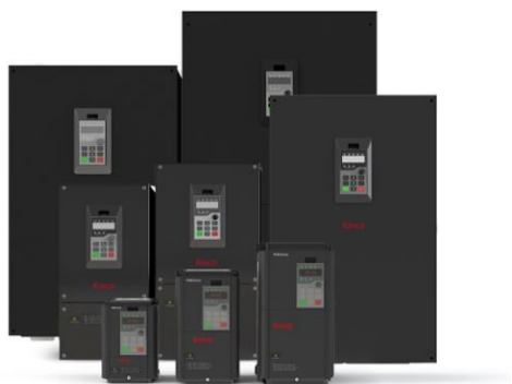
图 5 公司低压变频器产品

应用于物流设备、环保设备、食品机械、服装机械、纺织机械、机床工具、起重机械、包装机械等领域。