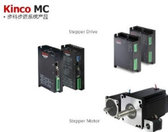
图 4 公司步进系统产品

公司将伺服驱动器和伺服电机组成伺服系统，将步进驱动器和步进电机组成步进系统，为客户提供运动控制解决方案。步进电机因技术成熟且市场供应充足，公司对步进电机采取外购的方式配合自产步进驱动器为客户提供步进系统。