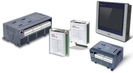
图 2 公司可编程逻辑控制器产品