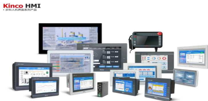
图 1 公司人机界面产品

通常用于连接可编程逻辑控制器、专用控制器、变频器等工业自动化控制类产品，利用显示单元（如液晶模组）显示机器设备的运行状态等实时信息；在人机界面上可利用输入单元（如触摸屏、键盘等）写入工作参数或输入操作命令等，从而实现人与设备信息交互，是各类工业自动化生产设备的标准配置。主要应用于物流设备、医疗设备、工业机器人、食品机械、服装机械、纺织机械、轨道交通设备、包装机械、塑料机械、电子制造设备、印刷机械等领域。