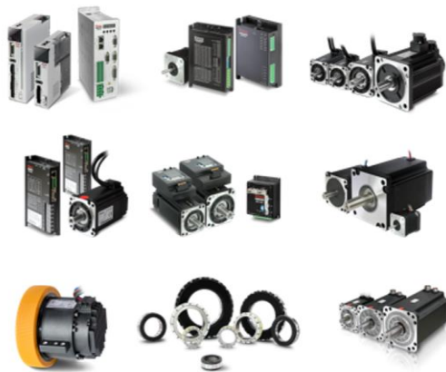
图 3 公司伺服系统产品

低压伺服系统主要应用于移动工业机器人、协作机器人、特种机器人、服务机器人、无人叉车、医疗设备等领域。