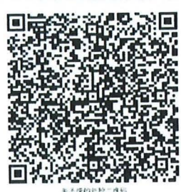
数字防伪检验二维码

本证书经检验合格，继续有效一年。 This certificate is valid for another year after this renewal.