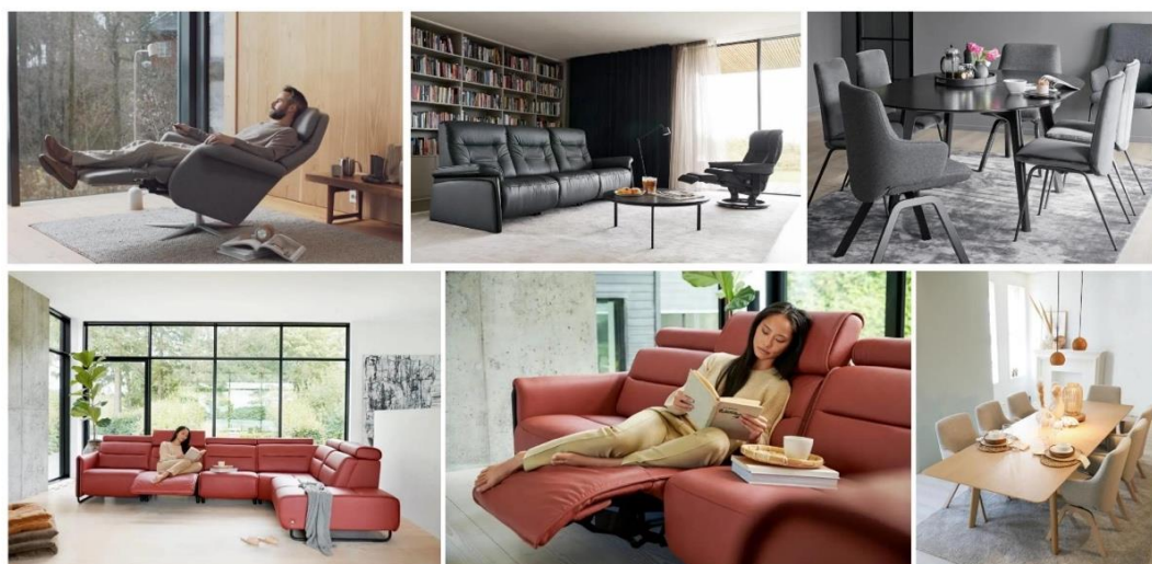
Stressless山姆Sam电动椅、Stressless Mary沙发 / Mayfair舒适椅、Mint轻便椅、Emily沙发、月桂餐厅系列

曲美家居坚持以用户需求为中心，以契合消费者需求的品牌定位、一站式全品类布局、强大的产品研发和制造实力、境内外品牌合力发展，与时俱进，形成品牌增长新势能。