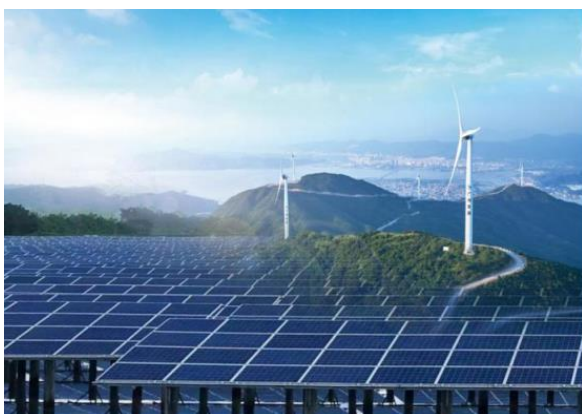
图 4：新能源公司风电、光伏场站图

产业规模持续壮大，新领域新业态加速发展，经营指标保持快速增长，报告期内完成发电量 23.71 亿千瓦时，同比增长 40%。上半年立项规模超过 40 万千瓦，备案规模超过 200 万千瓦。顺利完成广东省内存量项目年度绿电交易，合约电量 4.7 亿千瓦时，同比增长 181%。全面加强精益化运营管理，科学部署设备检修、技术改造、智能监测等工作，机组平均利用小时数同比提升，