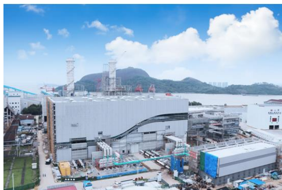
图 1：珠江 LNG 电厂二期

充分发挥发售电一体化优势，优化电煤采购策略，深化精准配煤掺烧，发电效益持续改善，整体盈利能力大幅提升。燃煤电厂与珠电燃料公司协同努力，提高长协煤兑现率，加大掺烧经济煤种力度，标煤单价同比下降；年度电力长协签约价格及签约率均高于全省平均水平，月度中长期和现货交易策略不断优化，售电量足价优。报告期内合并口径火力发电企业完成发电量 83.61 亿千瓦时，上网电量