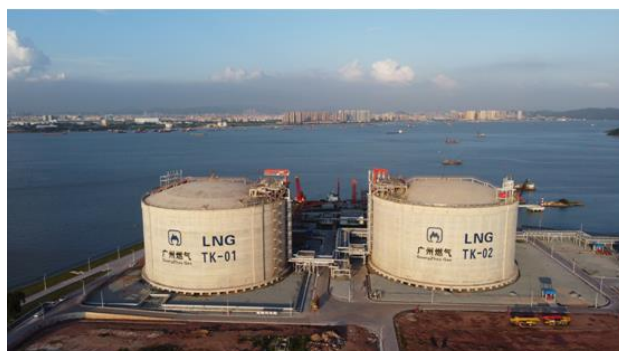
图 3：广州 LNG 应急调峰气源站

把握市场机遇，发挥长协优势，开展国际贸易业务，实现利润同比倍增。做强做优天然气贸易，上半年累计销售气量超过 6 亿立方米，同比增幅超 3 倍。多渠道组织气源，灵活调整气源资源池结构。挖掘广州周边城区潜在用气需求，整合串联上下游资源，实现与周边燃气企业互联互通，打造区域外销售新模式。报告期内管道燃气及 LNG 销售量 14.7 亿立方米，同比增长 59.87%。