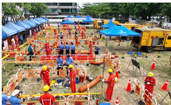
图 12：应急抢险抢修技能竞赛现场

截至 6 月 30 日，未发生一般及以上生产安全事故，实现连续安全生产 5,488 天。 防范化解经营风险。 全面深化合规管理体系建设，加强重大决策、重要事项审核。