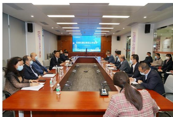
图 11：合理化建议专项工作会议