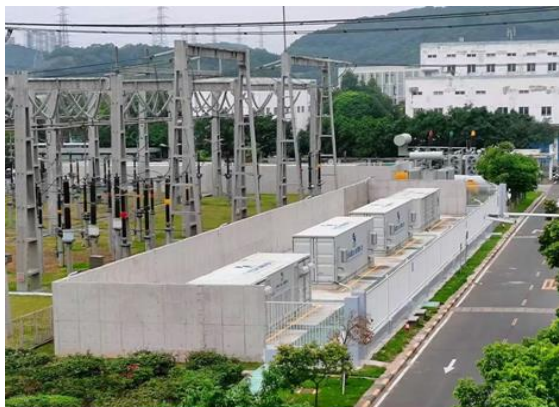
图 10：珠江电厂储能电站

筑材料科学技术奖一等奖”。新增专精特新中小企业 9 家，累计有效专利超过 700 项、名优高新技术产品 7 项。