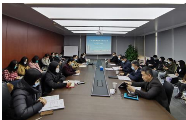
图 5：财务公司提高发展质量工作会议

融资租赁公司围绕能源主业和转型升级战略方向，配合新能源高质量发展开展业务。加强与市属国企间业务协同，把握优质项目机遇，稳妥开拓外部业务。