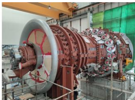
图 7：珠江 LNG 电厂二期项目 2 号燃机复装完成

优拓布局稳中向好。 新增河北天润 150MW 风电项目，实现云浮罗定、开平赤水、亿纬锂能等光伏项目并网发电；山东、山西、宁夏等地风电项目积极推进，广西上思、乐昌云岩等自建项目加快建设。积极推进珠江 LNG 电厂三期、粤西（茂名）LNG 接收站项目前期工作，投资红海湾电厂二期项目扩建，助力大湾区构建清洁低碳、安全高效的能源保障体系。