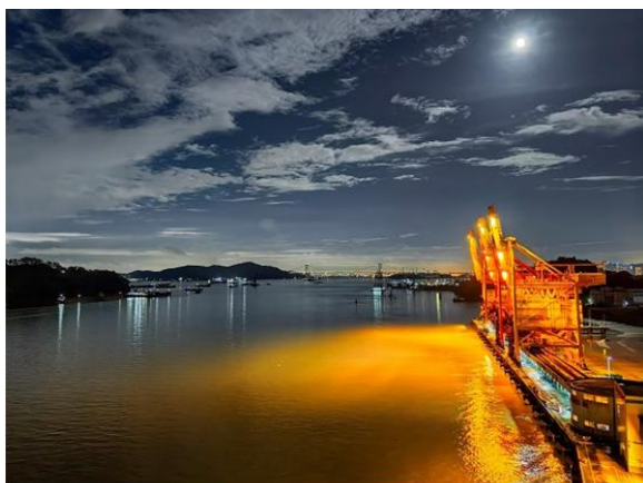
图 2：能源物流集团发展港口公司