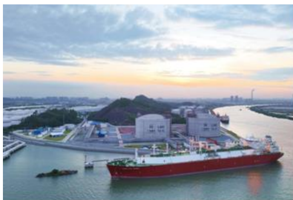
图 6：广州 LNG 应急调峰气源站首船 LNG 到港接卸

重点项目稳中有进。 上半年 14 个市重点项目投资 17 亿元。珠江 LNG 电厂二期项目 1 号机组成功点火并完成蒸汽吹管等里程碑节点；明珠能源站项目完成燃气锅炉调试并具备供热条件；广州 LNG 应急调峰气源站储气库项目基本完工，配套码头工程于 8 月进入试产阶段，配套管线工程加快建设并实现调试段供气；广州市天然气利用四期工程实现中新知识城能源站配套管线全线贯通；广州开发区东区恒运燃气管线工程通气投产；明珠能源站配套管线工程基本完工；金融城综合能源项目取得供冷管网工程规划许可证；旺隆气电替代工程初步具备开工条件；珠江电厂等容量替代项目推进核准申请。