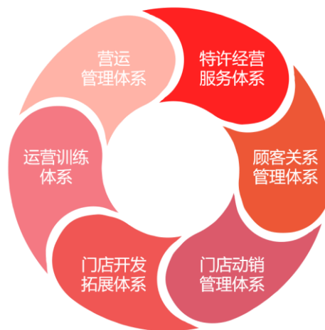
图3 公司加盟连锁渠道管控体系

公司构建了以“产品组合—单店模型—加盟体系”为核心要素的连锁加盟管理机制，通过加盟商月刊、加盟商大会、自媒体、微课堂、标杆人物评选等多种形式层层宣导，与加盟商形成命运共同体，让加盟商自发地维护品牌形象，持续成长，形成加盟商生态圈。