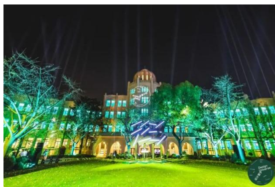
东长治路 505 号优秀历史建筑