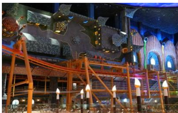
武汉梦时代室内乐园过山车

梦乐园“颠倒之城”室内弹射式影视特效过山车和“时空博物馆”黑暗乘骑两大全国首创项目。报告期内，上海霍洛维兹荣获 TRUE 文旅超级评价榜（智慧文旅类）“2023 模范文旅运营商”称号。7 月，上海霍洛维兹自主开发的青岛市市南区《山海胜境》文旅元宇宙 APP 上线，以 AR 技术数字赋能青岛传统文旅地标和老建筑。