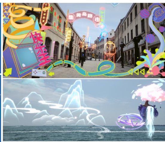
《山海胜境》文旅元宇宙 APP