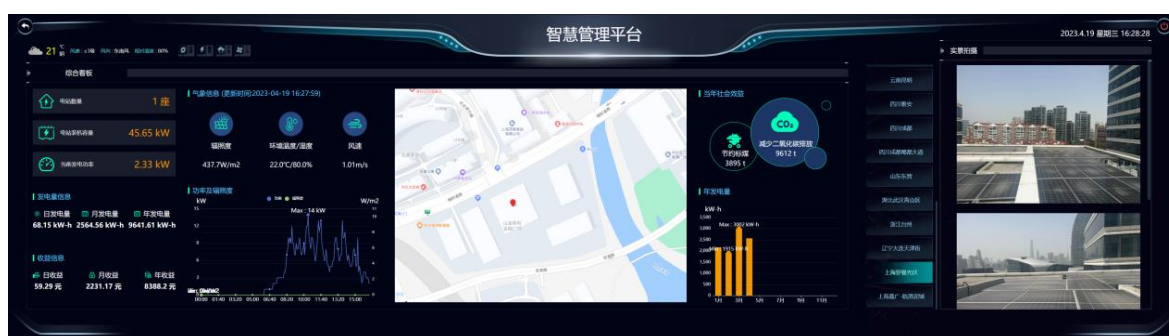
罗曼智慧管理平台

一体化服务。6月，中标大连市委、市政府光伏及照明项目。公司结合目标客户的需求，努力打造以风、光、储为场景的项目投资、建设、运营、维护以及基于综合能源解决方案的楼宇和园区数字化服务。公司通过技术升级和节能改造，为城市提供高效、节能的路灯系统，进一步减少能源消耗，助力城市能源的可持续利用。罗曼慧云管理平台以及能源云管理系统在本报告期内持续开发应用场景，为数字化智慧城市管理提供精准服务，致力于优化城市品质，焕发城市新活力。这些系统的不断创新与应用，有助于提高公司在智慧城市领域的竞争力，同时为客户提供更高效的服务。