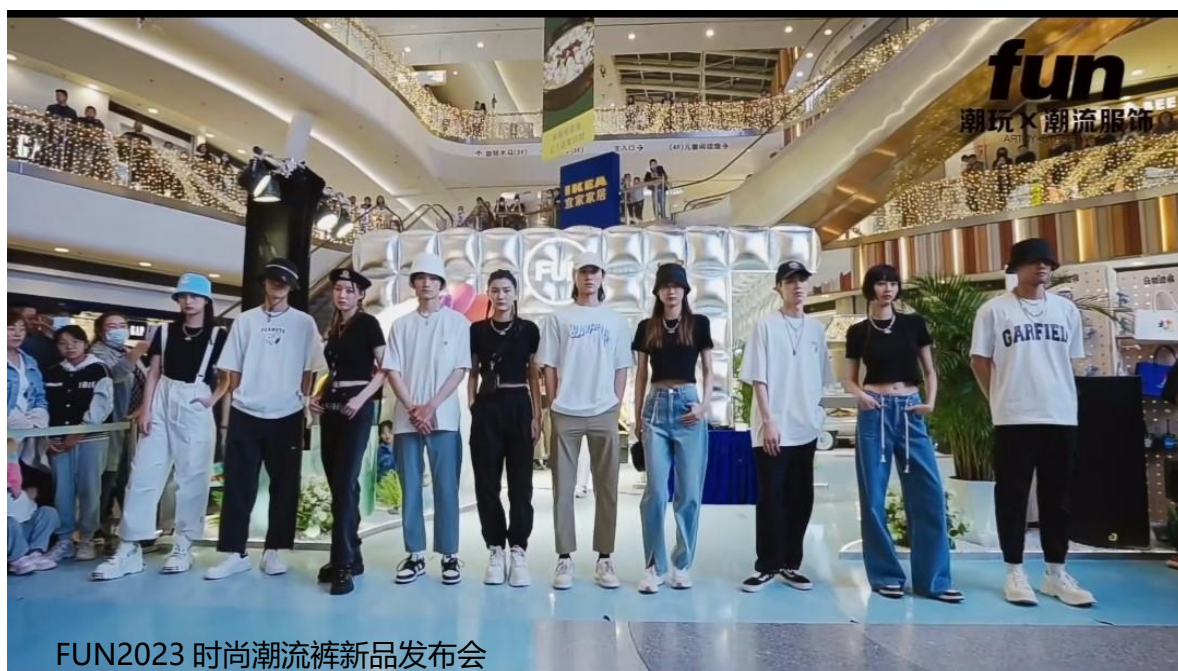
FUN2023 时尚潮流裤新品发布会

报告期内，FUN 品牌持续进行渠道结构的优化升级，升级第五代形象店铺，提升店铺形象及店效；品牌方面，通过“天工开物”国风限定快闪活动、“玩物造裤”快闪活动吸引众多博主、达人到访打卡；产品方面，强化商品企划，聚焦核心优势品类T恤，同时聚焦裤单品，于报告期内发布 FUN2023 时尚潮流裤新品，潮流与时尚、舒适与酷感兼备的各类潮裤新品惊艳亮相。