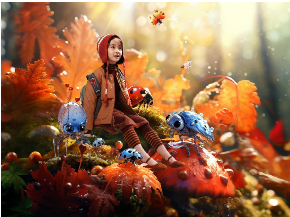
播 broadcute 童装时尚大片