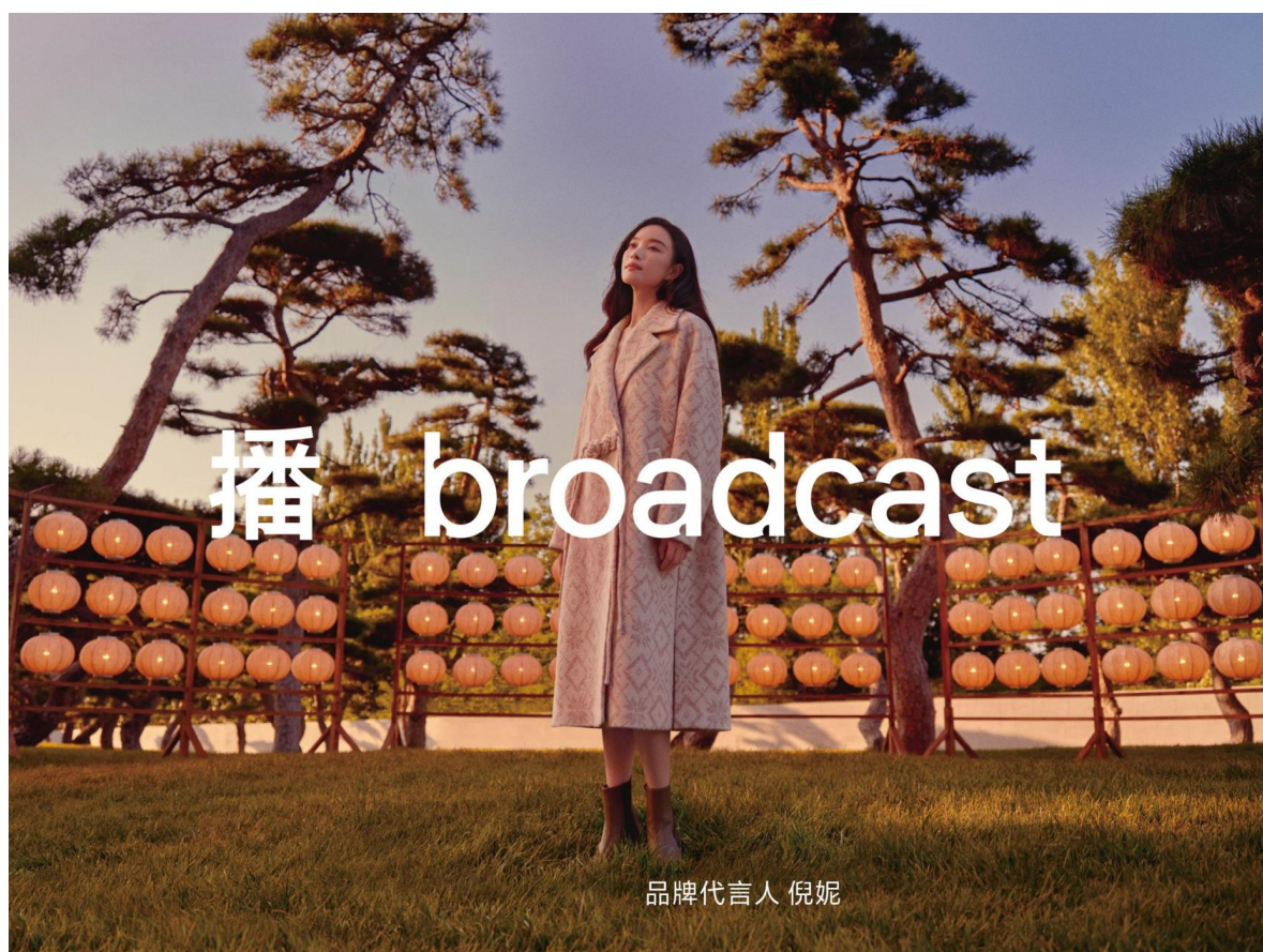
播 broadcast 时尚大片

“播 broadcast”品牌创立于 1999 年，是中国早期真正意义上原创性的都市女装品牌之一。成立至今，都市中成长型女性的处世价值始终是品牌美学的对焦之处。率真、从容而不失时代性的女性形象是品牌一贯的心中缪斯，它所折射出的自在，是心灵觉知下的本然状态。这份睿知与自在，既是 [播 broadcast] 此刻的坐标，也是下一段旅程的起点。